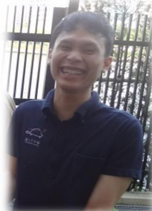
Azil : kaigofukusisi