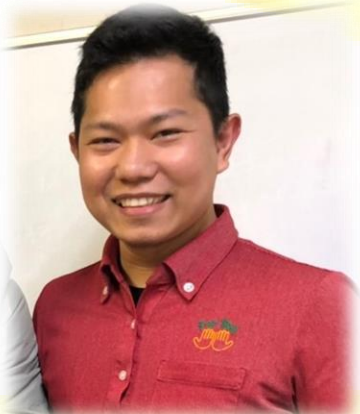
Aris : kaigofukusisi

Di HOUYUKAI meskipun orang asing memiliki kesempatan untuk memiliki jabatan, jika kalian berusaha dan bisa bekerja layaknya orang Jepang. Jika memiliki jabatan maka kalian akan memiliki bawahan orang Jepang dan gajinya pun tambah banyak. Jika kalian lulus ujian negara, bonus dan gajinya otomatis bertambah. Jadi kalian juga harus banyak belajar supaya bisa lulus ujian negara layaknya kakak kakak di atas ya!