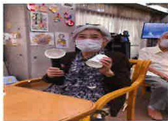
優勝者はなんと21個も取られました！！おめでとうございます！！