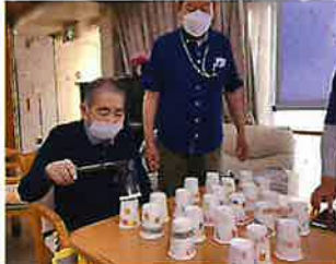
他の方々も検討されました！！