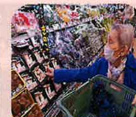
お買い物サービス