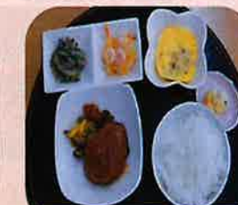
夕食提供サービス