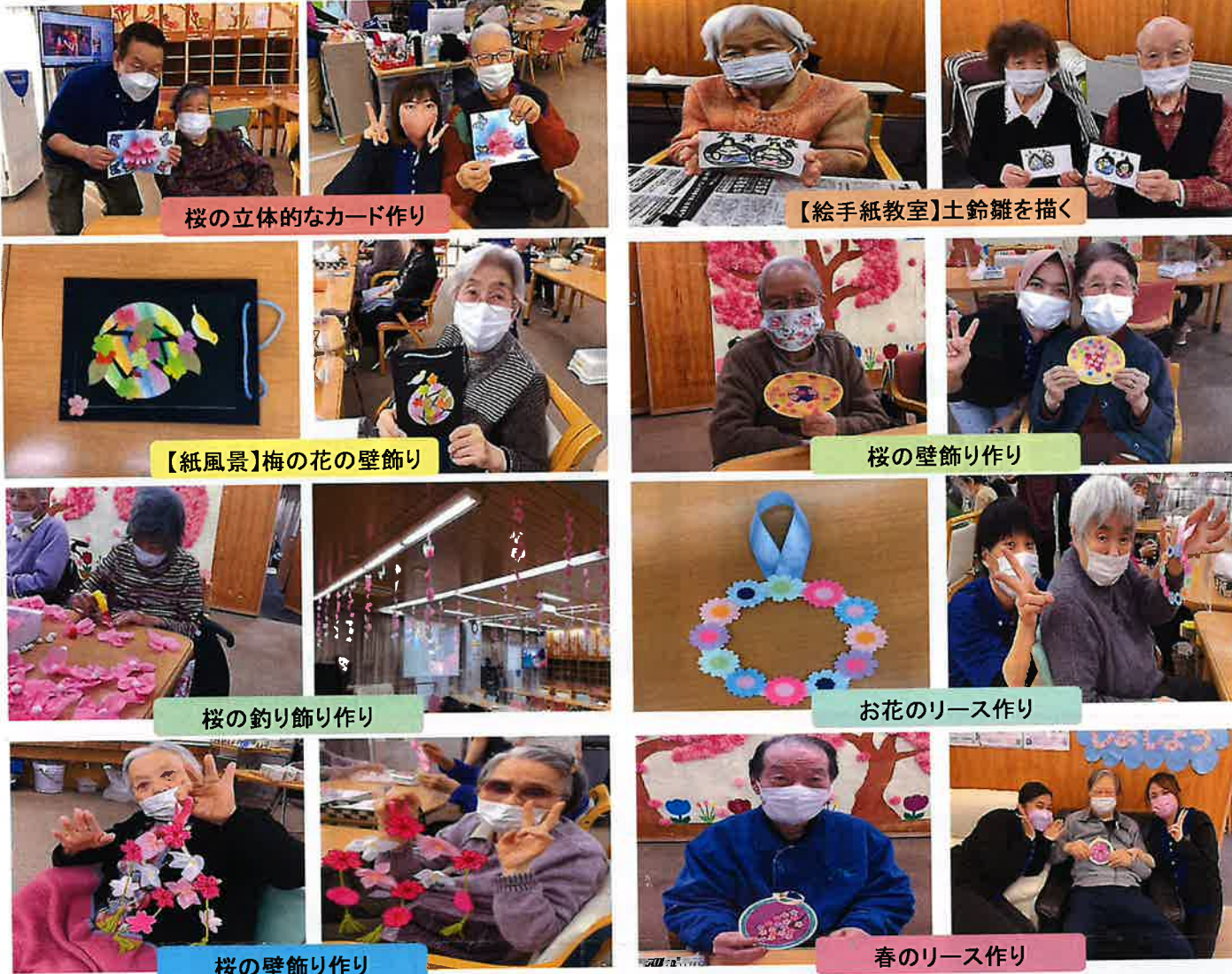
桜の立体的なカード作り