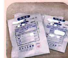
お薬受け取り代行

ご利用者様・ご家族様のお困りごとに寄り添い、いつまでも安心してご自宅でお過ごし頂けます様日々サポートして参ります。ご要望が御座いましたら、遠慮なくお申し付け下さい。