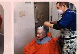
ヘアカットサービ(月曜日のみ)