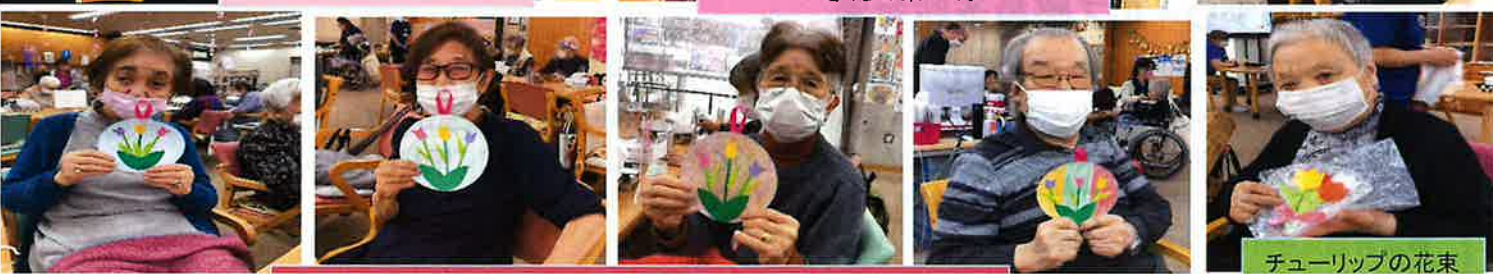
チューリップの花束