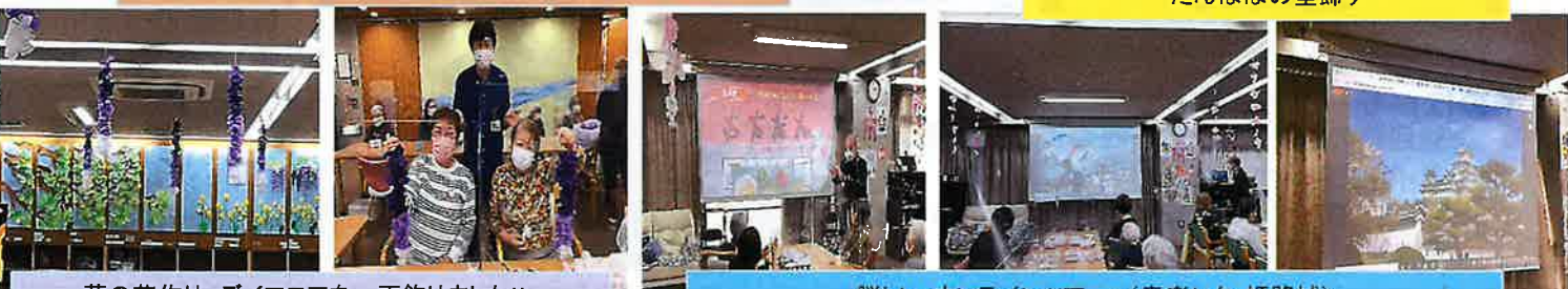
藤の花作り デイフロアを一面飾りました！！