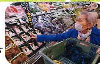
サミットお買い物代行サービス

麦茶・お水・牛乳など重たい物が購入出来、しかも、家まで持ってきてくれてとても助かっています！！