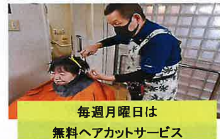
毎週月曜日は 無料ヘアカットサービス

ご利用者様・ご家族様の日常生活のお困りごとに対して、介護保険サービスなどの有料サービスを活用するまでもなく、 無償 もしくは、 低額 で提供する奉優会独自のサービスです。 いつまでも安心してご自宅でお過ごしいただけます様日々サポートして参ります。 ご要望が御座いましたら、遠慮なくお申し付け下さい。