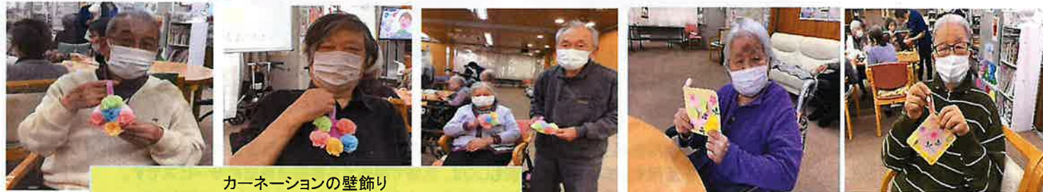
カーネーションの壁飾り

手工芸を通して、たくさん春を感じていただきました！！オンラインツアーの音楽レクリエーションでは懐かしい春の歌の数々を桜の名所と一緒に楽しみました。