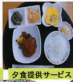
夕食提供サービス