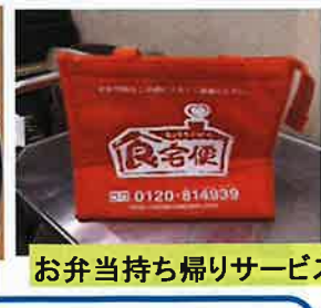
お弁当持ち帰りサービス