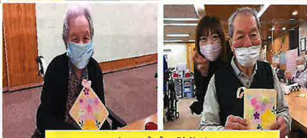
たんぼぼの壁飾り