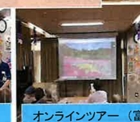
オンラインツアー (富士芝桜祭り・東武動物公園)