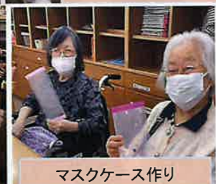
マスクケース作り