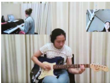
アメリカンスクールの学生さん たちによる演奏♪

コロナ禍において停止を余儀なくされていたボランティア活動ですが、現在リモートで徐々に増えてきています！ 楽器の生演奏をはじめ、ヨガ、タンゴ体操、落語、芸人さんによるおしゃべりなど内容もさまざま。いつものボランティアさんはもちろん、アメリカンスクールの学生さんやアルゼンチンからのリモートもありました！