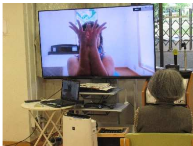
タンゴのリズムに合わせて タンゴセラピー体操