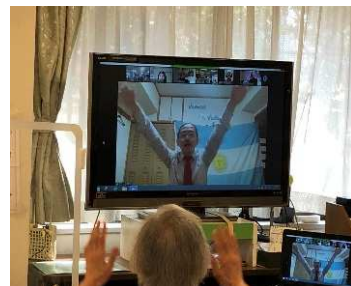
地球の裏側・アルゼンチン からこんにちは！