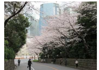
送迎中もお花見気分♪ 左は京浜運河沿い、右は高輪プリンスホテル