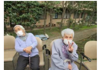
ぽかぽか陽気で気持ちいい〜