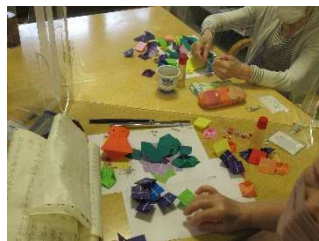
花びらと葉っぱをノリでベタベタ♪