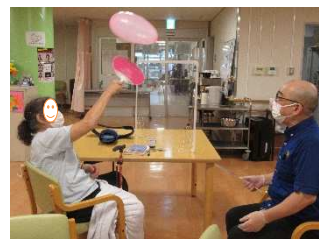
風船の行方をしっかり捉えてスマッシュ！