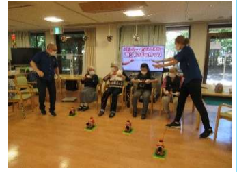
真剣にやるとなかなか手が疲れます...