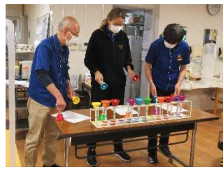
余興は職員によるハンドベル演奏♪