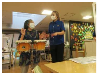
楽しそうな笑顔がステキです！

職員による定期演奏会、今月は参加型で開催しました。まずは職員が見本としてボンゴを叩き、その後、利用者様の中から挑戦者を集めました。ご参加いただいた利用者様も、演奏後はご満悦の笑顔でした♪