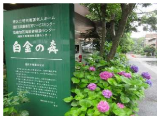
施設の花壇に綺麗な紫陽花が！

白金の森では本格的な梅雨入りを迎え、施設の花壇ではもちろん、施設の中にも綺麗な紫陽花が咲きました。「梅雨」にちなんだイベントということで折り紙で作った紫陽花を自由に紙に貼り、お持ち帰りいただきました。