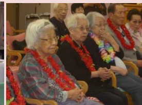
午後のプログラムゲーム