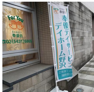
明薬通り沿いのUR住宅 アクティ三軒茶屋8棟1階