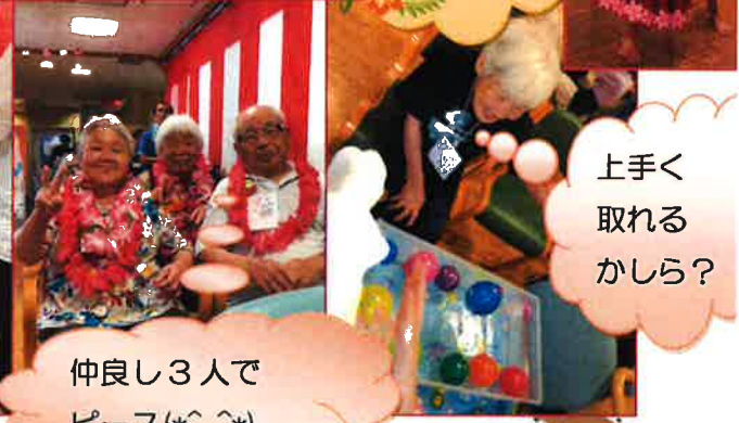
仲よし3人で ピース(*^_^*)