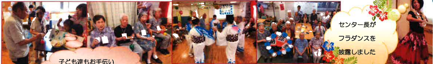
子ども達もお手伝い してくれました☆☆