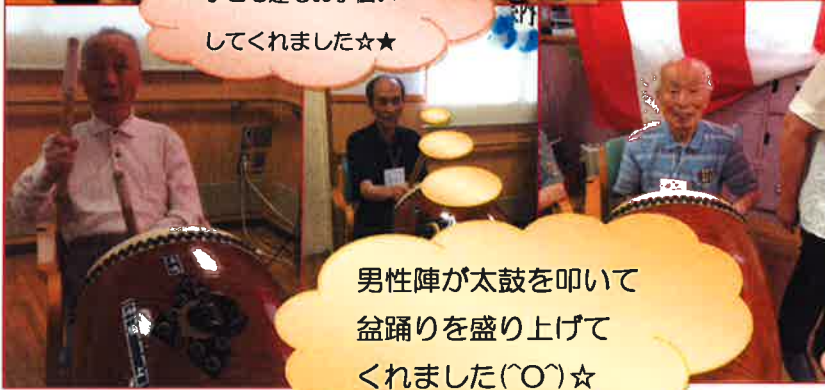
男性陣が太鼓を叩いて 盆踊りを盛り上げて くれました(〇)☆