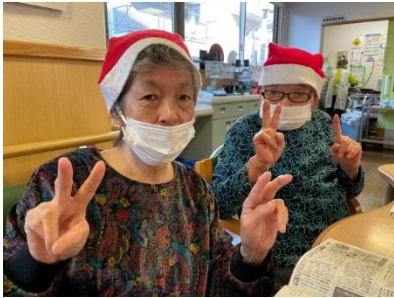
メリークリスマス(^o^)

12月24日(木)はクリスマス会、12月28日(月)は忘年会を開催しました！ 今年はコロナ禍の為ボランティアさんを招いたイベントは開催できません でしたが、制限された環境下で最大限に楽しめるイベントとなりました！