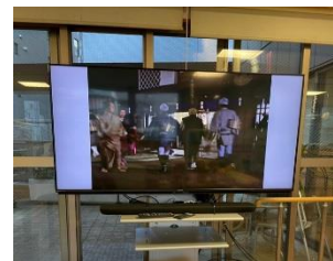
2階・3階の方も、映画鑑賞を楽しめます\(^o^)/

お正月は、リモート初詣に参加！！栃木県の佐野厄よけ大師の中継を楽しみました！初詣の雰囲気少しでも味わえたと思いません\(^o^)/☆☆☆