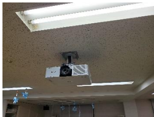
ついに！！笹幡デイにもプロジェクターが導入されました!(^^)!