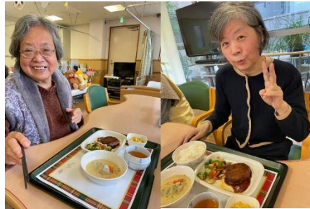
クリスマス料理も大好評！！