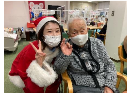
職員がサンタに大変身！！(笑)