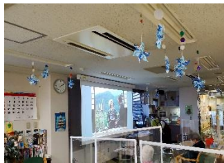
クリスマス会や忘年会で大活躍！