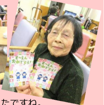
1年間ありがとう！楽しかったですね。小学校に行っても元気でいてね。