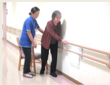
各自の体力、歩行力に応じて、手すりを使ったり、施設の周囲を歩いています。