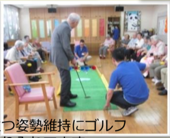
安定して立つ姿勢維持にゴルフゲームを取り入れています。