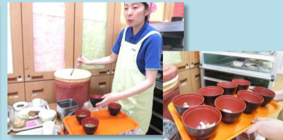
配膳直前に汁物を注ぎます。とろみや水分制限の方にも注意します。