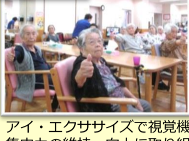
アイ・エクササイズで視覚機能、集中力の維持、向上に取り組みます。