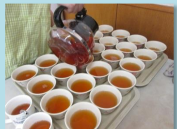
11時30分頃からほうじ茶の準備をします

デイサービスの入浴、排泄、送迎など、さまざまな仕事を紹介する新コーナー。第1回は、配膳のお仕事です。ご利用者様の楽しみである昼食をおいしく、安全に食べて頂けるように、スタッフはご利用者様の元へ御膳を配膳します。刻み食やミキサー食などその人に合った形状で配膳をするために、細心の注意が必要です。看護師は、朝確認した薬などを配ります。