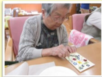
押し花作りは、ピンセットを使うことで、指先の力を鍛えます。