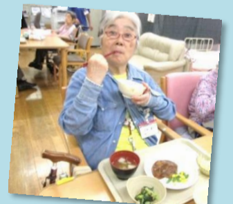
今日も無事に配膳完了！いただきます！