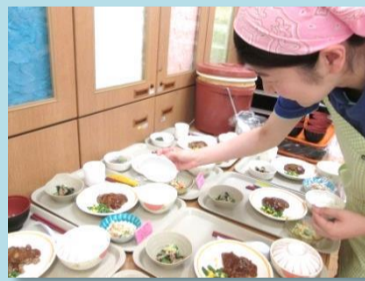
食札の指示された内容と食事が合っているかを確認します。