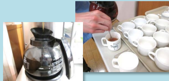
食後のコーヒー、紅茶の準備をします。食札や好みに合わせて、砂糖、とろみを調整します。