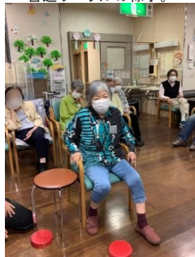
キックバックゲームの様子。