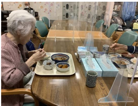
夕食サービスの様子。

私たちはご利用者の在宅生活の継続を支援する為通常のデイサービス機能に併せ、介護保険外サービス(無償低額サービス)を提供いたします。