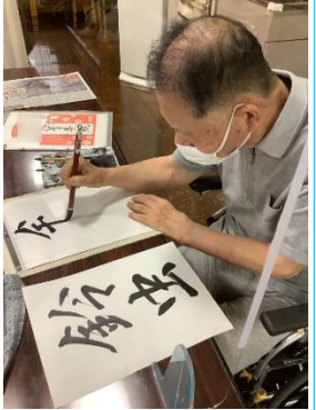
皆様真剣に書かれていました。