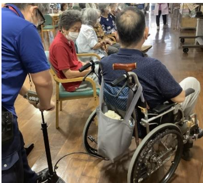
車椅子の空気入れ。

私たちが力を入れている「介護保険外サービス(無償低額サービス)」をご紹介します。介護保険ではカバーしきれない、自宅での生活の中でのちょっとした部分の支援(お手伝い)を行うことでいつまでも自宅での生活を続けて頂くことを支援するサービスです。