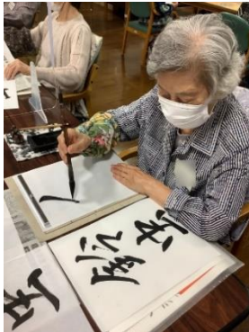
書道サークルの様子。

書道サークルでは「鈴虫」と「秋月」を書きました。皆様バランスよく書かれていました。ゲームプログラムでは手と足の運動を兼ねて、色々なゲームをご提供させて頂きました。中でも季節限定のゲーム「お月見ゲーム」は大盛り上がりでした！！