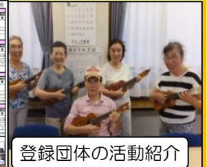
登録団体の活動紹介