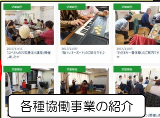
各種協働事業の紹介