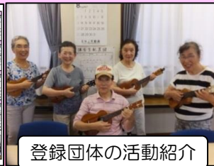
登録団体の活動紹介