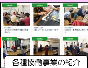
各種協働事業の紹介