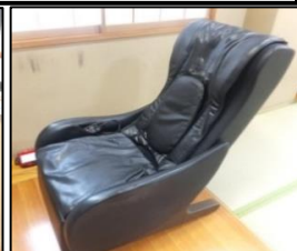
マッサージチェア