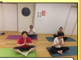
登録団体の活動紹介