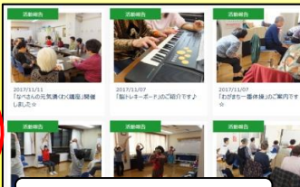
各種協働事業の紹介

ホームページでは、掲載以外のさまざまな事業のご紹介記事やご利用の案内などをご覧いただけます。