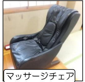
マッサージチェア