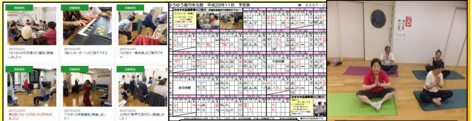
各種協働事業の紹介