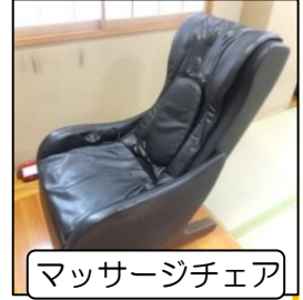
マッサージチェア