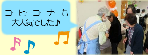
コーヒーコーナーも大人気でした♪