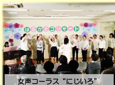
女声コーラス「にしじろ」