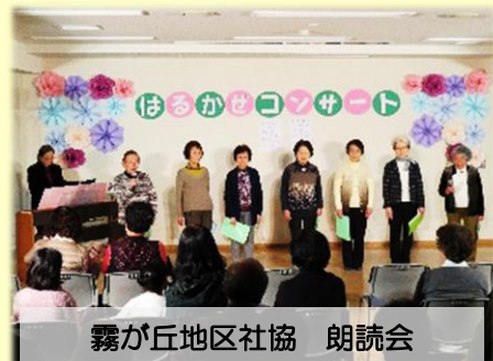
霧が丘地区社協 朗読会