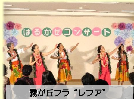
霧が丘フラ「レファ」