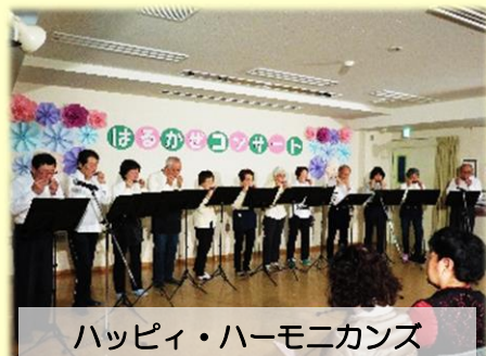
ハッピー・ハーモニクス