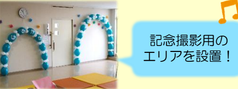
記念撮影用のエリアを設置！