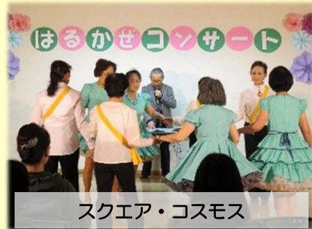
スクエア・コスモス

3月11日(日)、毎年恒例の「はるかぜコンサート」を開催しました。皆さん、日頃の活動の成果を発揮されていました。そして、たくさんの方にお越しいただき、終始温かな雰囲気で開催することができました。出演団体の皆さま、コンサートのお手伝いをしてくださったボランティアさん、お越しいただいた皆さま、本当にありがとうございました。