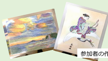
参加者の作品です