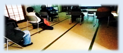
詳しくは職員まで！