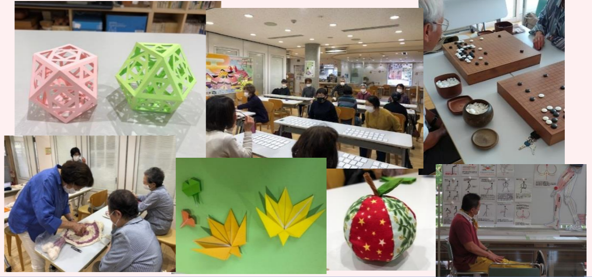
いきプラ体操、ぬり絵、百人一首、切り絵、囲碁、おりがみ、レディースなどのサロン

利用者の集まりから自発的に始まった「サロン」。今年も誰もが若々しい気持ちで様々な趣味を披露できる場として楽しく行われてきました。かつてフランスのサロンに文化の華があったように。