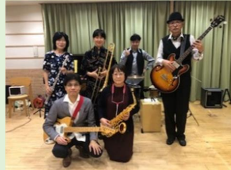
出演：ミュージックトレイン 社交ダンスバンド

日時：12月5日(日) 開場：13:45 開演：14:00～15:30 場所：1階 洋室 対象：港区民 定員：30名(抽選)