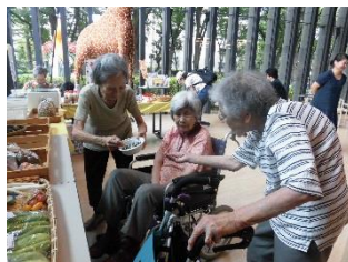
食と農の博物館♪ 食べ物について、農業について いろいろ見学！ お茶会も楽しみました(^o^)