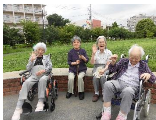
東山公園・新東山公園に お散歩へ♪ 草木やセミの声等、夏を 感じました！！ 皆さんも外に出て、気持ち よさそうにされておりました(^o^) 散歩は健康にいいので、 過ごしやすいこれからの 季節は、沢山お散歩に出 かけましょう！！