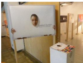
ものづくり学校♪ 顔はめパネルが沢 山ありました(^o^)