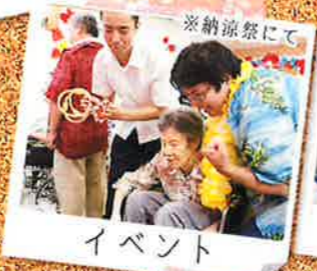
※納涼祭にて イベント

通常食・一口大・刻み・やわらか・ペーストまでの食形態に対応し、お一人おひとりの嚥下機能に合ったお食事をご提供します。