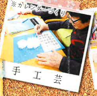
※カレイドスクリュー 手工芸