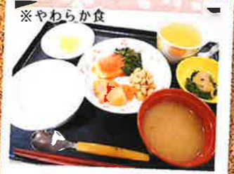
※やわらか食 様々な食形態

充実したプログラム “1日1回は身体を動かそう”をモットーに、その日のご利用者様に合わせた体操など運動プログラムをご提供しています。また、初詣・節分・花見・納涼祭・クリスマス会など季節のイベントにも力を入れており、四季折々の風情を感じて頂けます。天候が良ければ歩行訓練もかねて気軽に散歩にもご案内し、自然豊かな優つくり村のまわりを散策します。オリジナルティ溢れる手工芸やゲームも豊富に取り揃えており、楽しい時間を過ごして頂けるよう工夫を重ねています。