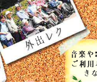
※深大寺公園にて 外出レク