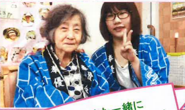
来年もまた一緒に 楽しみましょうね♡(∩。∩)ノ