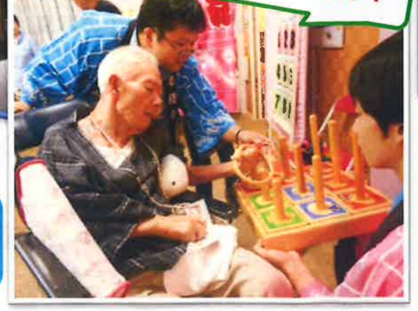
新種目 『ワニワニパニック』