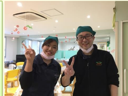
カラ茶屋でお待ちしております♪

もう3月だ…くしゅん(花粉症)←要注意 花粉症の時期が来てしまいましたね。インフルエンザの時も そうですが、マスクが手放せません！ 3月は、認知症カフェ(カラ茶屋)が開催されます。お時間あり ましたら、どうぞお越しくださいませ。(3月26日開催) 後日、連絡ファイルにチラシを入れておきます。 職員一同、ご利用者様との一日一日の時間を大切にし、 少しでも記憶に残るように頑張ります♪