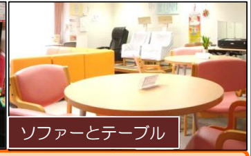
ソファとテーブル