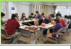
折紙紙サロンの様子