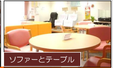
ソファとテーブル