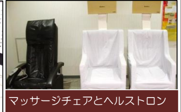
マッサージチェアとヘルストロン