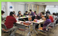
折り紙サロンの様子