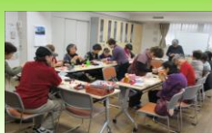
折り紙サロンの様子