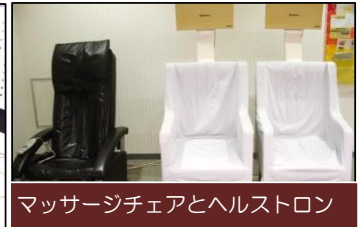
マッサージチェアとヘルストロン