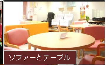
ソファとテーブル