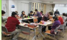
折り紙サロンの様子