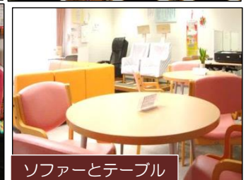
ソファとテーブル