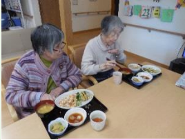
お楽しみメニュー(昼食)