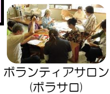
ボランティアサロン(ボラサロ)

「※受付終了しました」とある催しは、お申込みの受付をすでに締め切りました。当日の参加はできません。