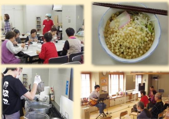
こだわりのそば出汁と恒例の「うたごえ喫茶」

日程：令和元年12月29日(日) 11:00～14:00 ※10:30から整理券配布(無料) 場所：白金いきいきプラザ 対象：60歳以上の港区民 定員：100名(先着順)