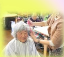
ヘアカットは毎月実施

看護師がおりますので安心です。 見学・体験随時 受け付けております。 送迎範囲はご相談ください。