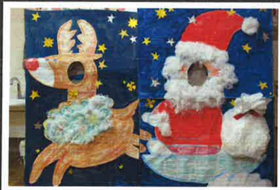
12月 クリスマス顔出し看板