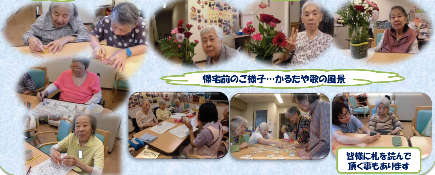
帰宅前のご様子…かるたや歌の風景