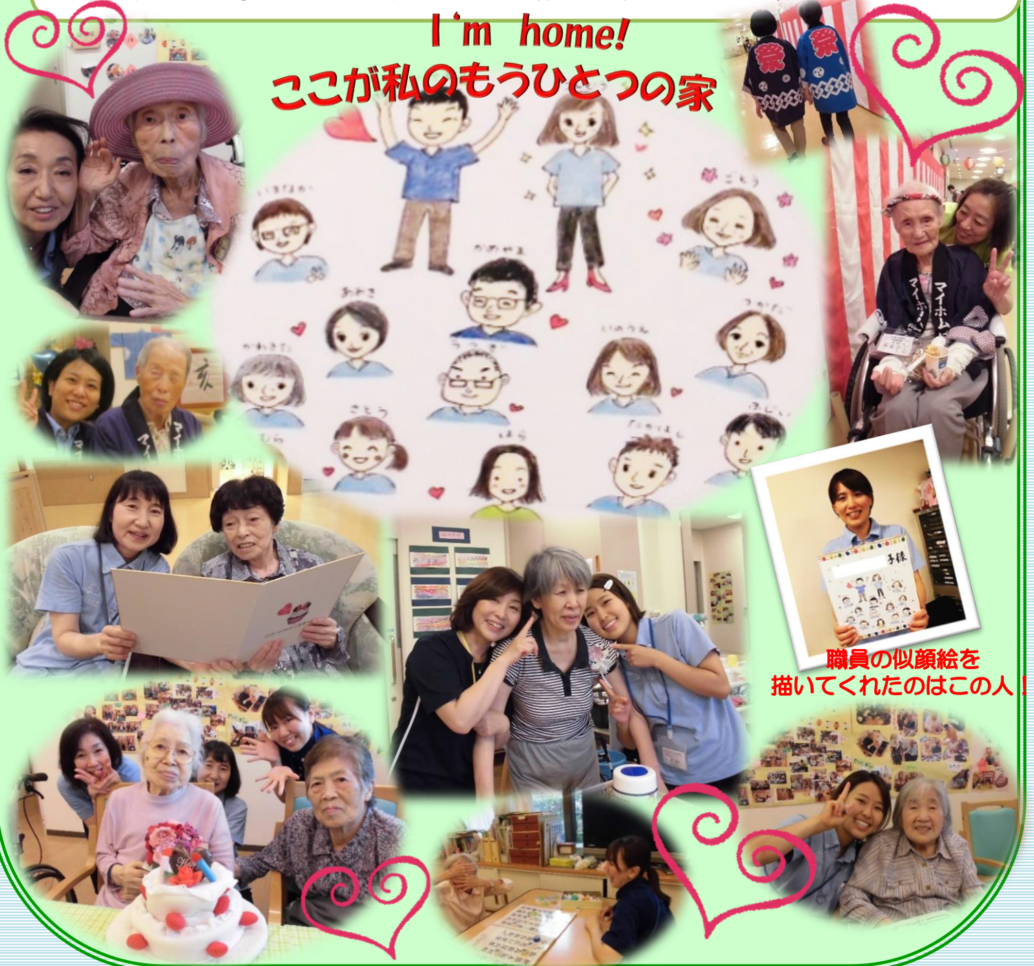
職員の似顔絵を 描いてくれたのはこの人!