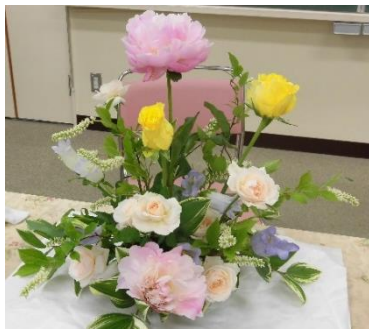
フラワーアレンジ (イメージ)