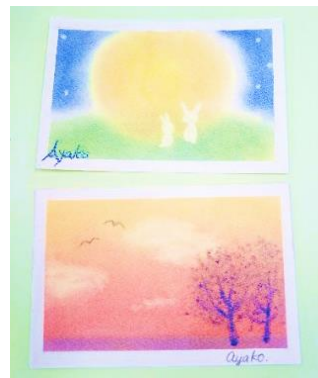
パステルアート (イメージ)