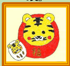
ちぎり絵サロン 2月 『寅』