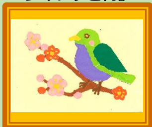
ちぎり絵サロン 3月 『うぐいすと梅』