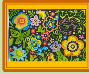
スクラッチアート 4月 『小さな花々』