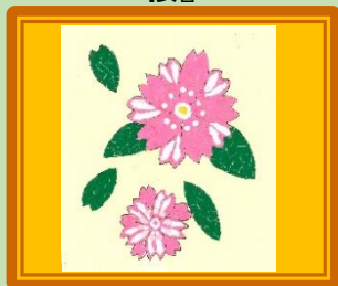
ちぎり絵サロン 4月 『桜』