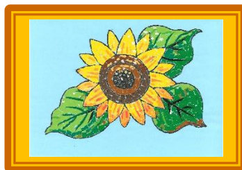
ちぎり絵サロン『ひまわり』