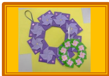
おりがみふあん『風車のリース』