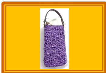
『ビニールテープで作るスマホケース』