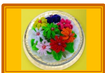
手しごとくらぶ 『モールの花』