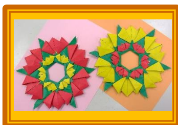
おりがみふあん 『チューリップのリース』