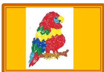
ちぎり絵サロン 『おうむ』