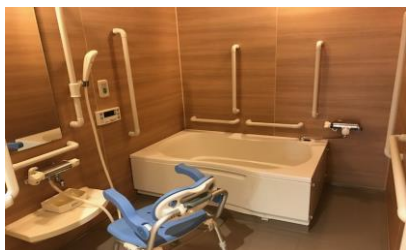
入浴サービス・一般浴