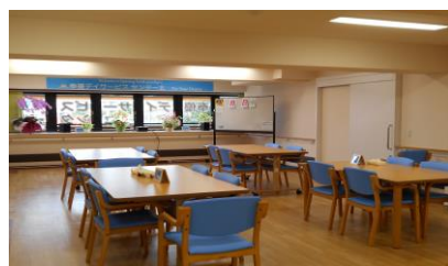
広々フロア 開放感のある明るいフロアで活動します