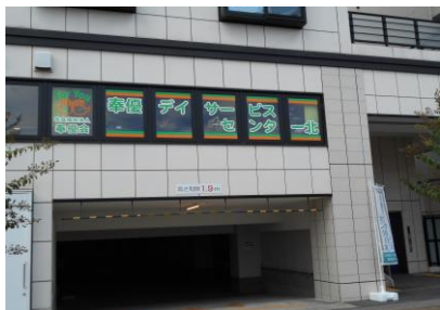
プリムラビル2階 階段・エレベーターで玄関へ