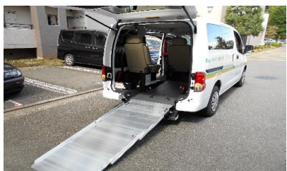
送迎サービス リフト付き車両で送迎します。 送迎範囲は都筑区全域です。