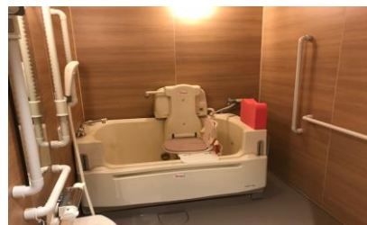
入浴サービス・機械浴