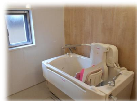
< パンジー浴 >