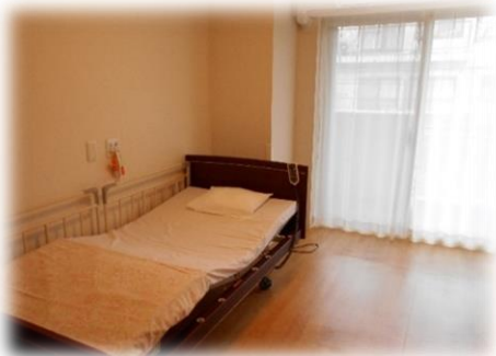
< 個室 >