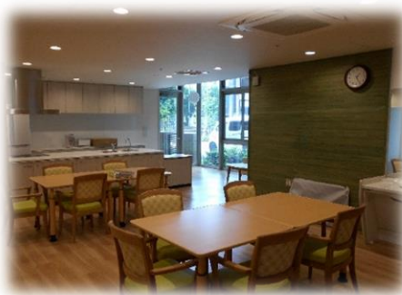
< 共同生活室 >