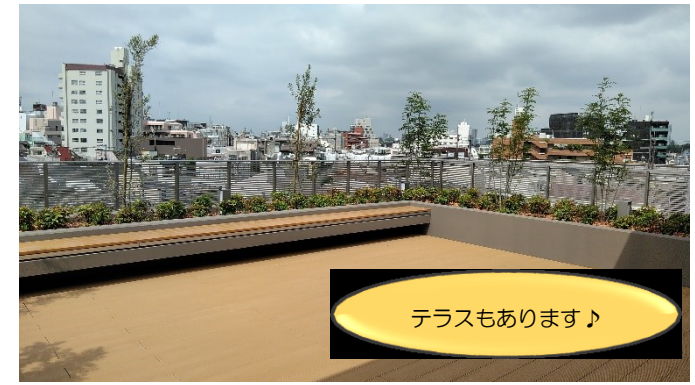
テラスもあります♪