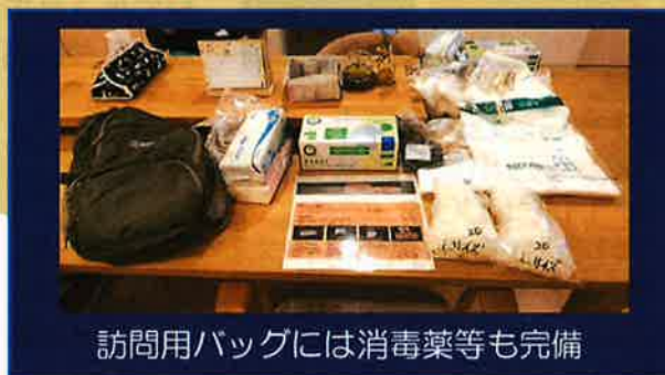
訪問用バッグには消毒薬等も完備