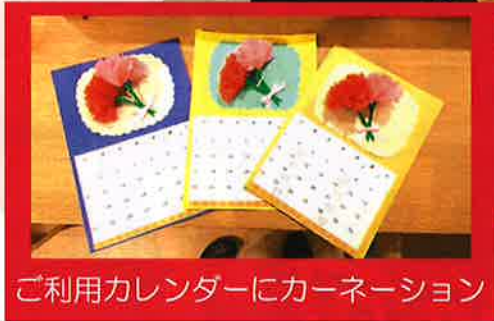
ご利用カレンダーにカーネーション