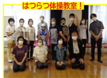
はつらつ体操教室！

9月30日(木)、敬老月間特別企画としていたばしプロレスリングの現役レスラー3名をお招きし、上記講座を開催しました。ストレッチや筋トレ、希望者はプロレス技をかけてもらう、という盛りだくさんな内容でした。